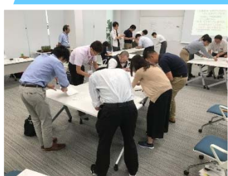
みんなで共同作業