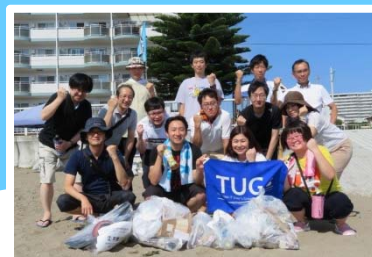
力を合わせて社会貢献

参加するまでは憂鬱でしたが、参加してみると、満足度も高く、参加して良かったと思いました。 (メディア業)