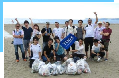
力を合わせて社会貢献