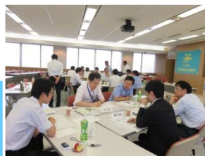
課題解決グループワーク