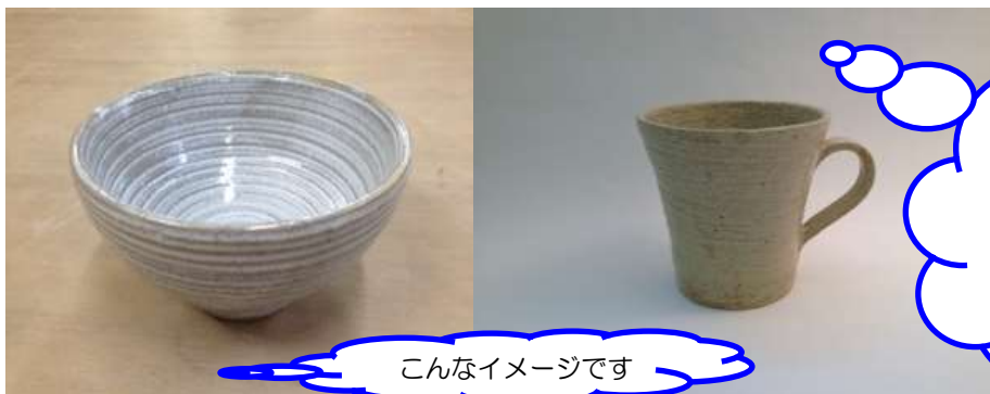
こんなイメージです

・追加の粘土代(自己負担)で基本コースより大きな作品をお作りいただくこともできます。 (当日、講師へお尋ね下さい。)